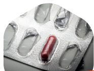
COMPRIMÉS, GÉLULES, POUDRE...

La récupération des médicaments non utilisés à usage humain par les pharmaciens est une obligation.