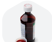
SIROPS ET SOLUTIONS BUVABLES