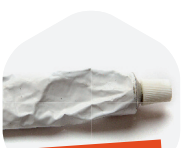
POMMADES, CRÈMES ET GELS...