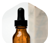
COLLYRES ET SOLUTIONS NON BUVABLES