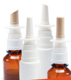
AÉROSOLS ET SPRAY